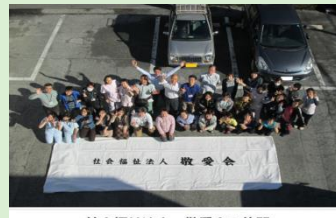
11:10～(希望者のみ) 先輩職員との懇親会