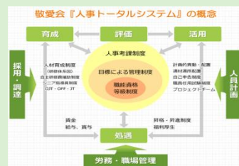
10:20～ 職員育成システムの紹介